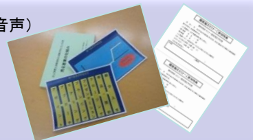
特典の一部(イメージ)